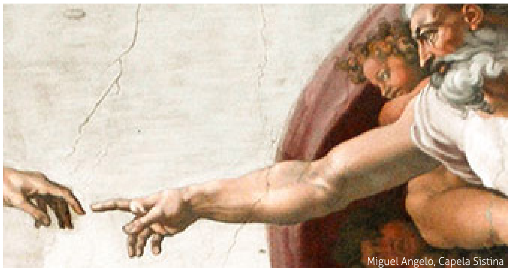
Miguel Angelo, Capela Sistina

¶ Entra em cena um leproso, um desesperado que perdeu tudo: casa, trabalho, amigos, abraços, dignidade e até Deus. É um homem que se está a decompor estando vivo, para a sociedade é um pecador, recusado por Deus e castigado com a lepra. ¶ Vem e aproxima-se de Jesus, e não deve, não pode, a lei impõe-lhe a segregação absoluta. Mas Jesus não escapa, não evita, não o manda embora, está de pé diante dele e escuta. O leproso devia gritar de longe, a quem encontrava, «imundo, contagioso»; em vez disso, tu a tu, sussurra: se quiseres, podes tornar-me puro.