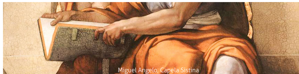
Miguel Angelo, Capela Sistina

JOSEMARIA ESCRIVÁ, CRISTO QUE PASSA (EXCERTOS)