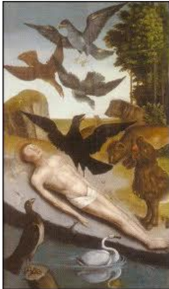
O corpo de São Vicente protegido pelo corvo

No século VIII os mouros invadiram a península ibérica e toda a zona de Valência. E os cristãos da zona, com medo resolveram fugir, de barco, levando as relíquias do mártir São Vicente.