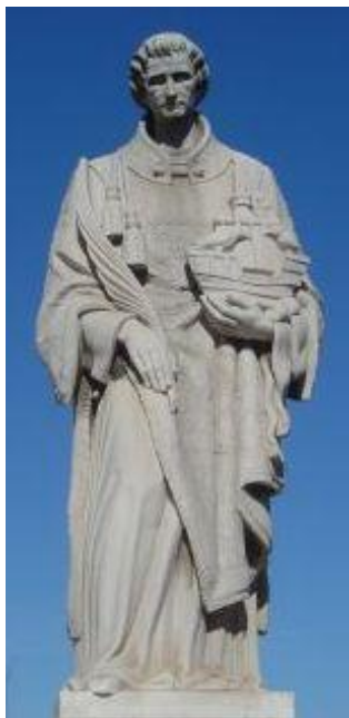
São Vicente Padroeiro de Lisboa

Hoje celebra-se o dia de São Vicente, mártir, padroeiro de Lisboa.