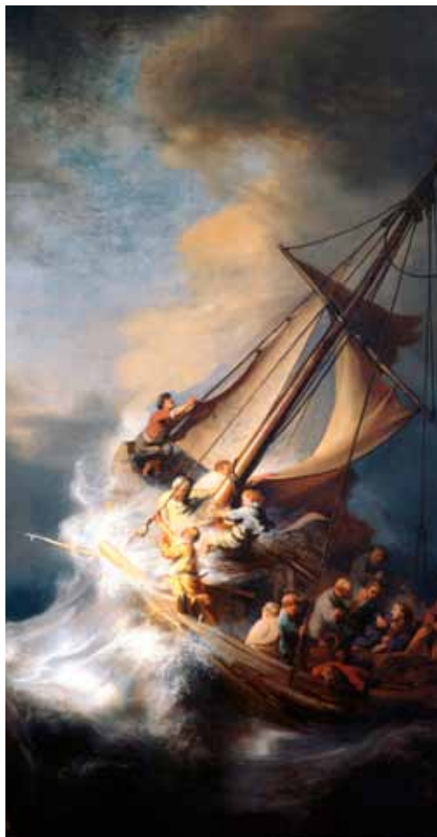
Rembrandt. Cristo durante a tempestade no Lago da Galiléia

Qual o motivo de falares assim e de seres sacudido pelas ondas do lago e pela tempestade? É porque em ti Jesus dorme; quero com isto dizer que a tua fé em Jesus adormeceu no teu coração. Que farás para seres libertado? Acorda Jesus e diz-Lhe: «Mestre, estamos perdidos». As incertezas da travessia do lago atribulam-nos; estamos perdidos. Mas Ele despertará, quer dizer, a tua fé voltará; e, com a ajuda de Jesus, reflectirás no teu coração e notarás que os bens concedidos hoje aos maus não durarão. São bens que