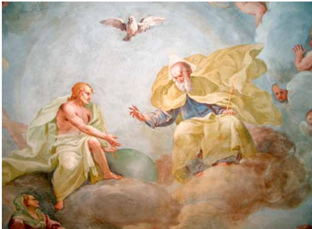
Holy Trinity, fresco by Luca Rossetti da Orta

Todos somos chamados a testemunhar e anunciar a mensagem de que “Deus é amor”, que Deus não está distante ou insensível aos acontecimentos humanos. Está próximo, sempre ao nosso lado, caminha connosco para partilhar as nossas alegrias, dores, esperanças e cansaços.