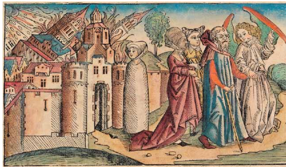
The Sodom and Gomorrah motif from the Nuremberg Chronicle by Hartmann Schedel, 1493.

Sobre a segunda vinda, o Senhor fala nestes termos em Isaías: «Olhai, vou criar uma Jerusalém destinada à alegria, e o seu povo ao júbilo. Jerusalém será a minha alegria, e o meu povo o meu júbilo; e doravante, não mais se ouvirão aí choros nem lamentos» (Is 65,18-19). Porque, como Ele disse também, «o Senhor enxugará as lágrimas de todos os rostos». Santo Antônio