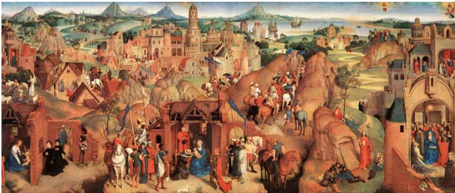
Advent and Triumph of Christ by artist Hans Memling

Redescobrimos a beleza de estar todos a caminho: a Igreja, com a sua vocação e missão, e a humanidade inteira, os povos, a civilização, as culturas, todos a caminho através das veredas do tempo.